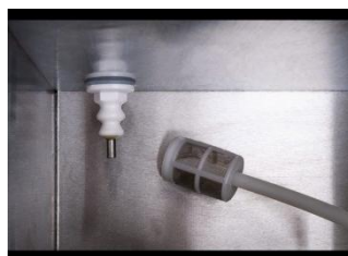
Bình chứa nước